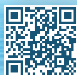
יומן פעמונים - ניתן להוסיף ליומן ג'מייל