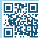
מכללת פעמונים לחינוך פיננסי