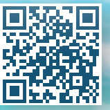
הצטרפו אלינו לקהילת פעמונים בפייסבוק