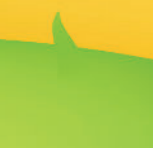
קישור לאנדרואיד מגרסה 9 ומעלה