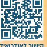
קישור לאנדרואיד מנירסה 9 ומעלה