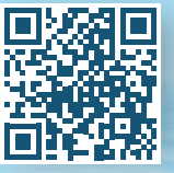
משחק תיק תקציב