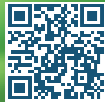
צפייה מודרכת: צריך או רוצה