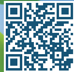
הצטרפו אלינו לקהילת פעמונים בפייסבוק