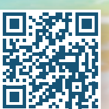
תעקבו אחרינו בערוץ הוואטסאפ של פעמונים