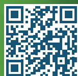
תעקבו אחריו בערוץ הוואטסאפ של פעמונים