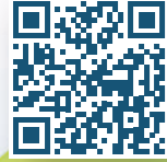
משחק: עוד חבילה הגיעה