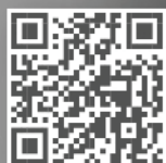
תעקבו אחריו בערוץ הוואטסאפ של פעמונים