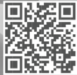
הצטרפו אלינו לקהילת פעמונים בפייסבוק